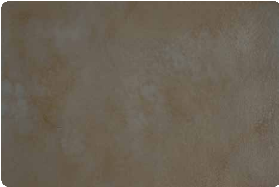
ACIDIFICADO HIERRO FUNDIDO