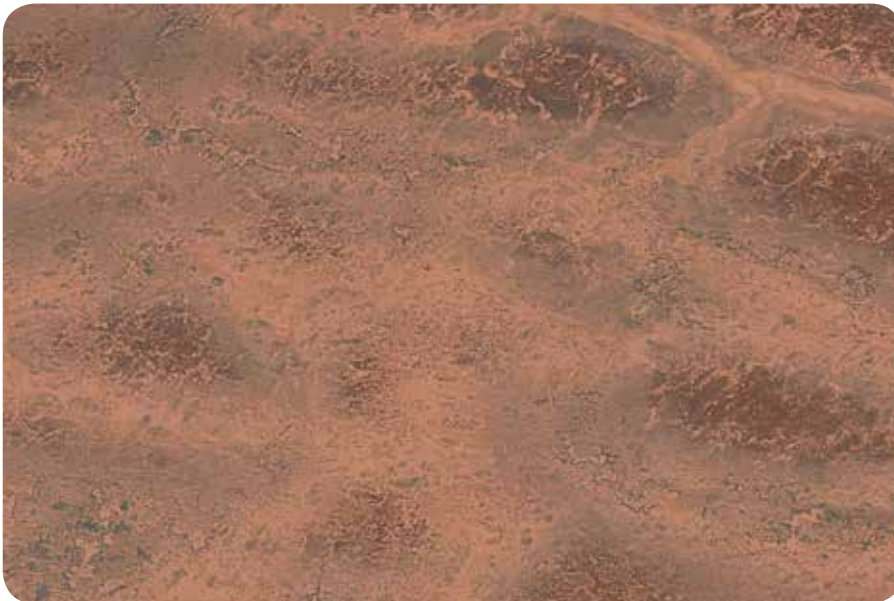
PIEDRA DE MARTE